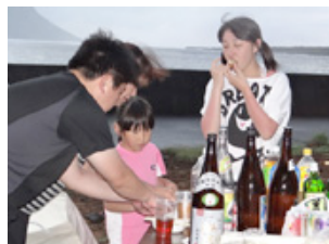
横間海岸で「よされ会」のバーベキューに参加