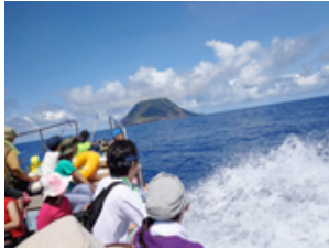
八丈小島に船で向かう