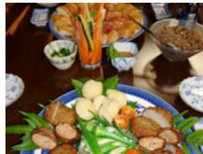
福八ハウスで島寿司や島料理