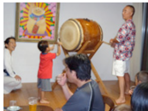
ちびっ子の太鼓うまい！！