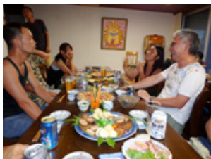
交流会という宴会が進みます