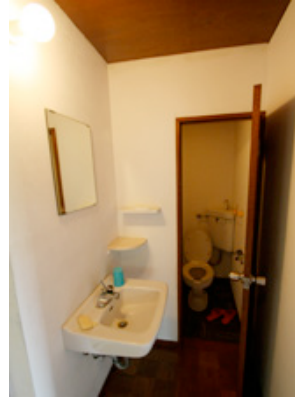
宿泊部屋内洗面所