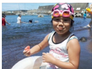
海でスイカ うれしそう～