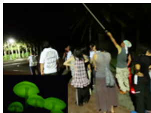
光るキノコ 夜空の星観察会