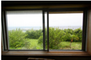
各部屋から海一望