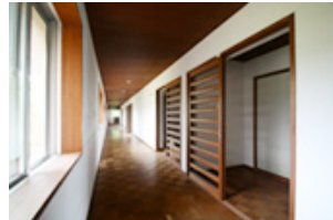
各部屋をつなぐ廊下