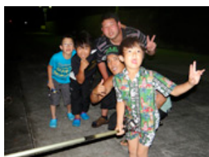
夜釣り 釣れた～！ スライドショー