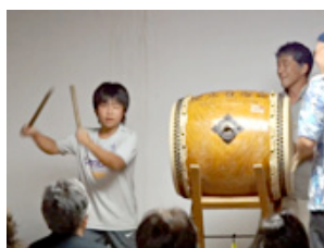
八丈太鼓体験 最終日 YouTube