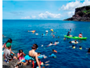
小島の碧い海で海遊び