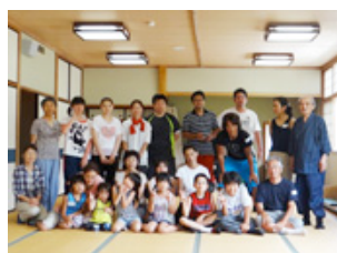
野口整体に参加しました