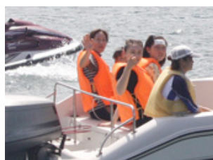
モーターボートや水上バイク