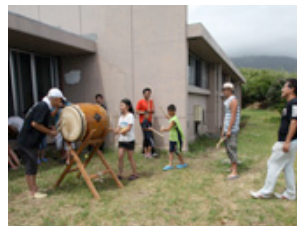
八丈太鼓の体験教室